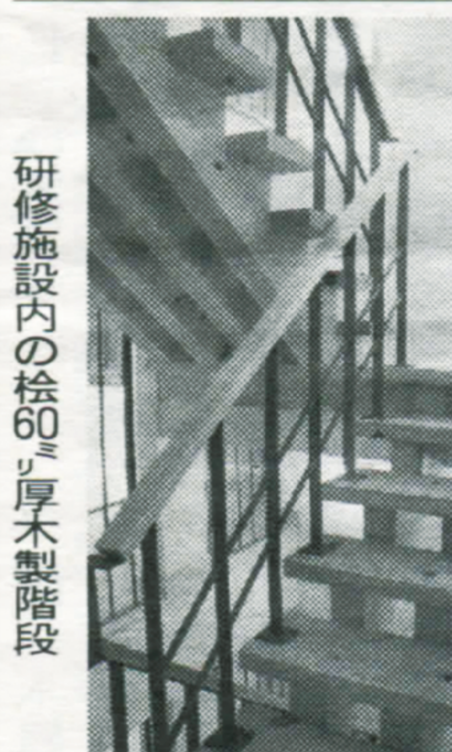
研修施設内の桧60ミ厚木製階段

ダーを育成する大学院で、京大では16番目の大学院研究機関として4月に始動した。研究活動等は近衛館で行われ、3月末に竣工